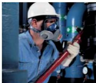
Configuración de dos puertos con combinación de cartuchos.

Su diseño se basó en medidas de características faciales de más de 8,000 personas.