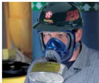
Configuración de un puerto con canister para máscara de gas estilo barbilla.